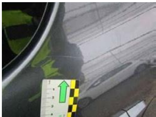
Graffi che non abbiano intaccato il film di vernice.