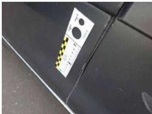
Scheggiature limitate al bordo porta.