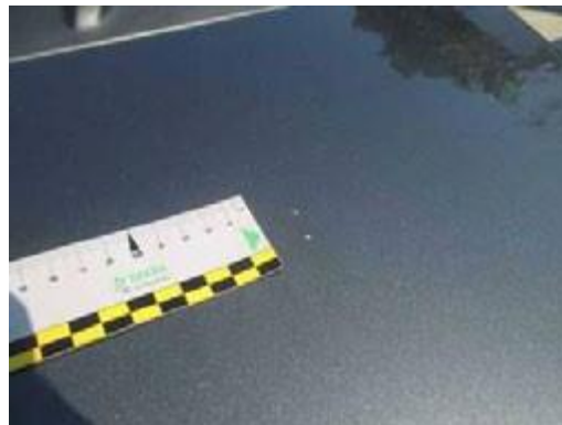
Scheggiature di dimensioni minori a 3 mm ed inferiori a n. 10 unità per elemento. In ilm di venice non dovrà essere intaccato.