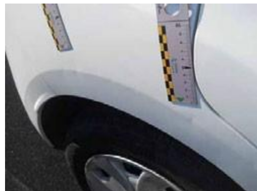
Massimo n. 3 bolli di dimensioni inferiori a 20mm senza sbocco del film di vernice.