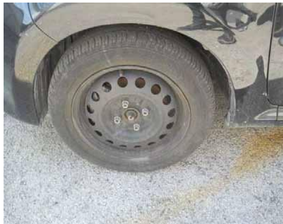
DISCO IN FERRO: