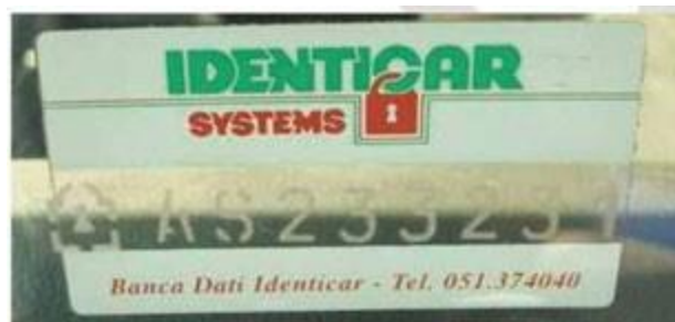
Esempio di marchiatura Identicar

La perizia sul veicolo sarà supportata da documentazione fotografica adeguata e leggibile dello stato del veicolo e delle anomalie riscontrate in fase di accertamento.